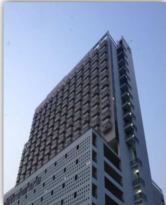
หอพักนักศึกษาหญิง