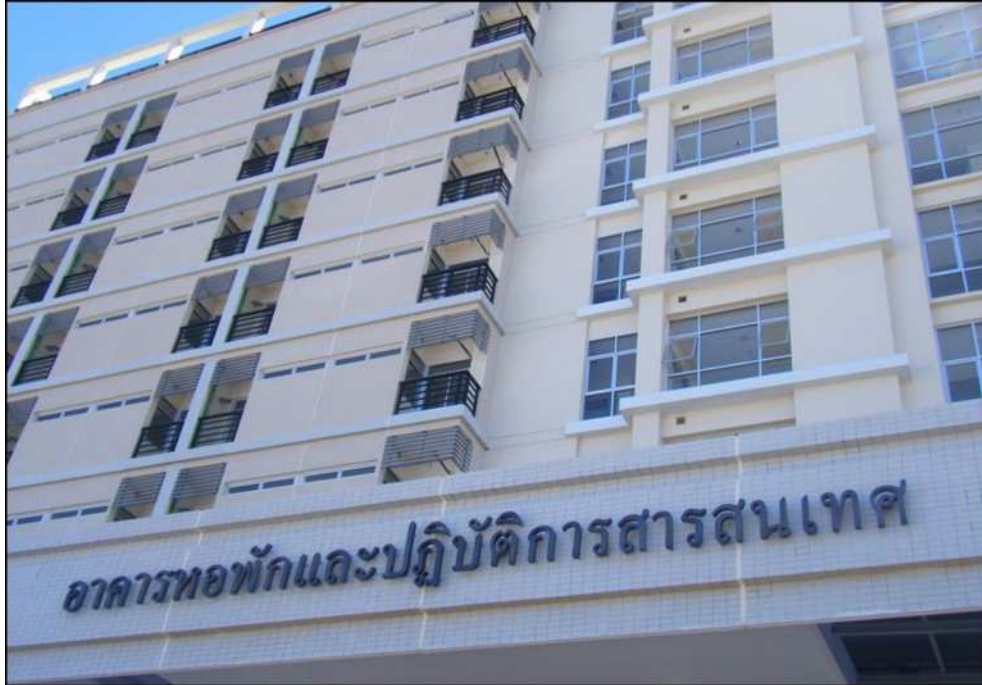
หอพักเจ้าพระยา สำหรับนักศึกษาชาย

คณะแพทยศาสตร์ฯ ได้จัดสวัสดิการหอพักนักศึกษาทั้งชายและหญิงไว้จำนวนหนึ่ง ซึ่งทางโรงเรียนฯ จะดำเนินการจัดสรรให้กับนักศึกษาตามความเหมาะสม โดยผู้พำนักในหอพักต้องชำระค่าหอและค่าประกันความเสียหาย และต้องปฏิบัติตามกฎระเบียบหอพักอย่างเคร่งครัด